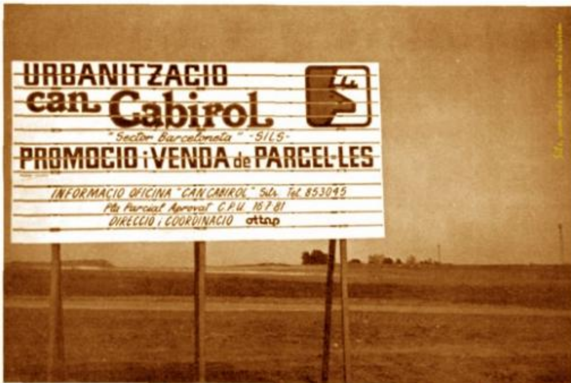
Rètol de la Urbanització "Can Cabirol", amb la indicació de que el Pla Parcial ja és aprovat.

Font del text i de les dues imatges inferiors: fragments de l'article de Carme Vinyoles a la revista Presència, 1 de febrer de 1982, pàgines 24 i 25.