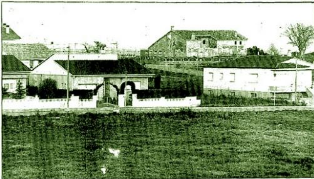
Una vista de l'urbanització Can Cabirol de Sils.